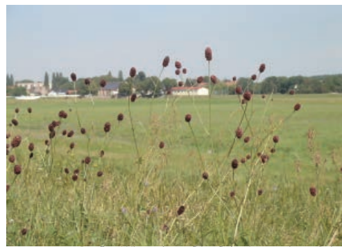
Großer Wiesenknopf (auf der Leutewitzer Seite)

heute teilweise versteckt unter einem Eschenblättrigen Ahorn (Acer negundo) noch zu sehen ist, befand sich ein Steinbruch. Viele Häuser und Mauern unseres Ortes wurden mit Hilfe dieses Gesteines gebaut. Granit steht hinter Merschwitz an. Trotzdem bereitete erst jüngst dieser schiefrige Gneis Schwierigkeiten bei der Verlegung der Düker zur Sicherung der Wasserversorgung von WACKER durch die Elbe. Nachdem diese Bauarbeiten beendet sind und die genutzte Fläche wieder begrünt ist, sorgte WACKER durch Nachpflanzung dafür, dass der Große Wiesenknopf (Sanguisorba officinalis) auf den Elbwiesen nicht verschwindet.