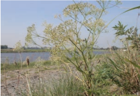
Sichelhorn (Falcaria vulgaris)

Ich erreiche die Elbe durch die kleine Gasse neben dem Grundstück „Am Ufer 1“ und wende mich nach links, bewältige das Wildpflaster und erreiche den Damm, der die dahinter befindlichen Flächen unterhalb der Meißner und Riesaer Straße vor Hochwasser schützen soll. Früher, zu Zeiten in denen viele Nünchritzer noch Kleintiere einstellten, war Grünfutter gefragt. Portionsweise wurde meist nach dem 1. Schnitt zur Heugewinnung (um Pfingsten) der weitere Aufwuchs nach Hause geholt. Die Vielfalt an Pflanzenarten war damals wesentlich höher als heute, wenn gleich maschinell die gesamte Fläche gemäht und beräumt wird. Trotzdem kann man sich hier noch an den Arten erfreuen, die ich elbabwärts vor den Grundstücken vermisste. Zwei weitere Arten seien genannt.