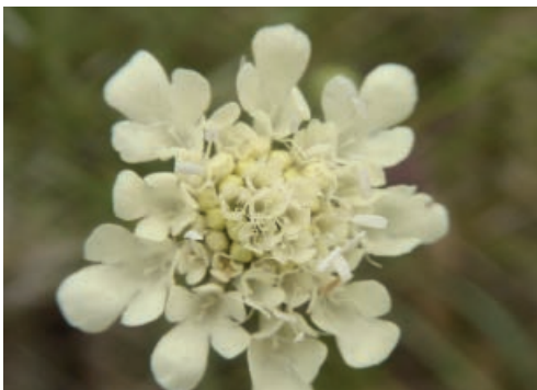
Gelbe Scabiose (Scabiosa ochroleuca)

Bald ist der Bereich der Kläranlage der WACKER AG erreicht. Nun sind es nur noch wenige Meter bis zu der Stelle, wo nach Demontage in Folge der Reparationen nach dem 2. Weltkrieg anfänglich und zuletzt nur noch mächtige Pfeiler aus Sandstein zu sehen waren. In den Zeiten, wo die Kranbahn Schüttgut aus den Elbkähnen aufnahm und in das Werk transportierte, fiel auch mal „Katzengold“-Pyrit (Schwefelkies) herunter, welches schön glänzte und die Sammellust von Kindern, auch meine, hervorrief.