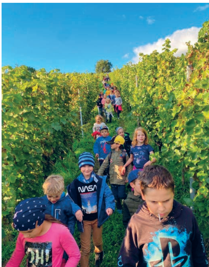
Das Team Hort „Schwalbennest“