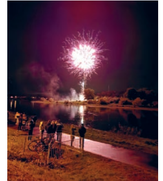
Das Feuerwerk am Sonntag ein würdiger Abschluss