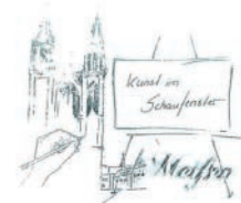
Klotzsche, Dieter Ölmalerei

Besichtigung: Di, Do, Sa, So und feiertags 10 - 17 Uhr Mi, Fr 10 - 14 Uhr, montags geschlossen