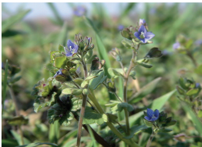
Abb. ND und Flora 37