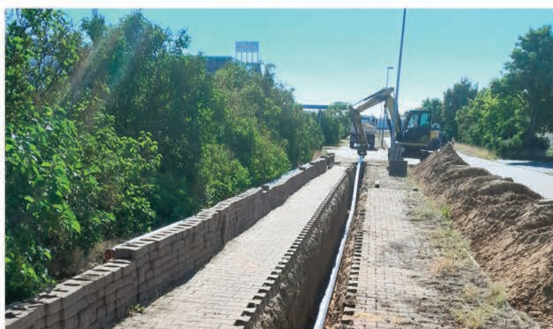
Die neue Trinkwasserleitung in der Industriestraße D dient der stabileren Versorgung der beiden Industriegebiete.

Um eine unterbrechungsfreie Versorgung der Gewerbegebiete Zeithain und Glaubitz und deren ansässige Firmen mit Trinkwasser gewährleisten zu können, wurde eine neue Trinkwasserleitung PEHD d 160 entlang der Industriestraße D verlegt. Diese 290 Meter lange Trinkwasserleitung dient der Verbindung der vorhandenen Trinkwassernetze beider Gewerbegebiete.