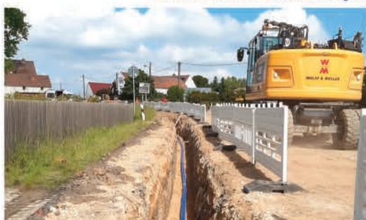
510 Meter neue Trinkwasserleitung wurden in Wildenhain innerhalb öffentlicher Verkehrswege verlegt.

Im Zuge der Straßenerneuerung der Neuen Hauptstraße (B98) durch das Landesamt für Straßenbau und Verkehr wurde ein Teil des Trinkwassernetzes in Wildenhain erneuert.