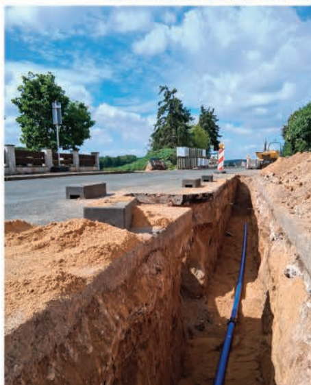
In der Dorfstraße werden neue Trinkwasserleitungen verlegt.

Im Zuge der Netzentflechtung in der Ortslage Goltzscha werden im laufenden Jahr neue Trinkwasserleitungen in der Dorfstraße sowie der Leckwitzer Straße verlegt.