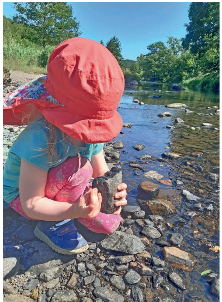
Bei einem genauen Blick ins Gewässer, kann man vieles entdecken.